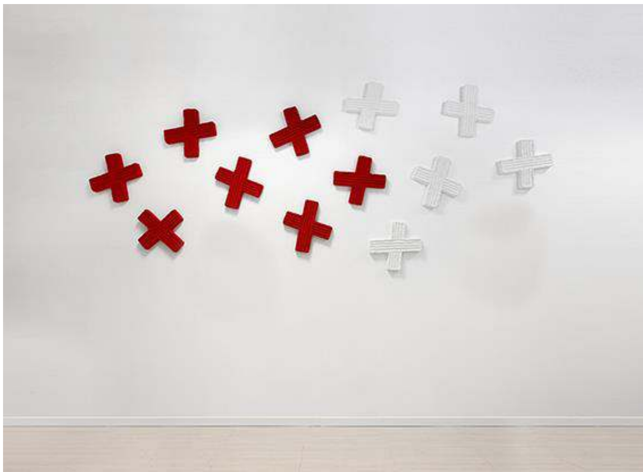
Pino Pinelli, Pittura R. B. 2016. Technique mixte, dissémination de 12 éléments 36 x 39 cm (chacun)